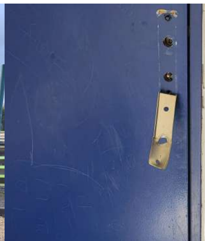
Porte des toilettes publiques

Nous rappelons à ceux qui l'auraient oublié que la liaison cyclable n'est pas un lieu de stationnement. Merci à vous.