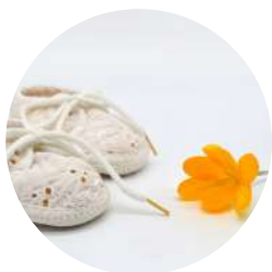
Léandro BELGIOINO né le 19 janvier 2026