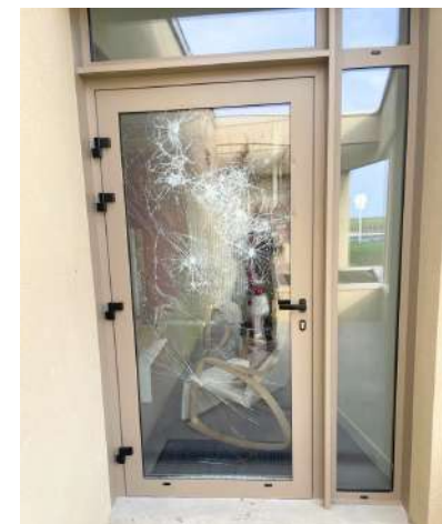
Porte de l'école des Oiseaux Bleus