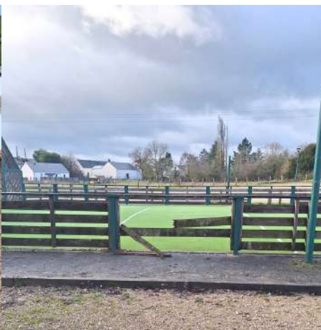
Barrière du City Stade